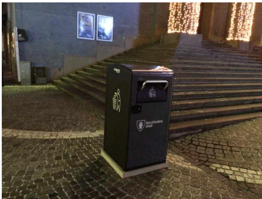
Komprimerande sopkärl som drivs av egengenererad solcellsel

Komprimering av avfallet och tömning då kärlet är fullt kan leda till färre transporter om det kombineras med anpassning av arbetssätt och tömningsfrekvenser. Eftersom kärlet är stängt minskar också risken för att fåglar och andra skadedjur kommer åt avfallet vilket minskar risken för nedskräpning. Kontoret har för avsikt att ansöka om klimatinvesteringsmedel för att finansiera kommande investeringar i komprimerande sopkärl.