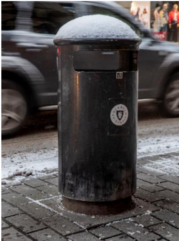
En av stadens ca 12000 skräpkorgar

Ett stort antal av de befintliga skräpkorgarna är relativt små och därmed inte anpassade för dagens livsstil där det är vanligt att köpa med sig mat i olika typer av förpackningar som snabbt kan fylla upp en skräpkorg. Trafikkontoret och stadsdelsförvaltningarna arbetar därför med en långsiktig plan för att byta ut äldre korgar mot större papperskorgar och till komprimerande kärl, bland annat på platser som periodvis har många besökare som t.ex. parker, torg och andra stråk. I samband med utbyte av skräpkorgar kommer samtliga nya utrustas med askkopp för uppsamling av fimpar. För att minska risken att skräp hamnar i vattnet där det är svårt och dyrt att samla upp är det extra viktigt att t.ex. badplatser, kajer, bryggor och strandnära lägen har en effektiv avfallshantering och städning. Antal och placering av skräpkorgar kan också anpassas utifrån årstid och olika händelser eftersom det i hög grad kan påverka besöksantal och beteenden på platsen.